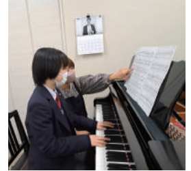
ピアノ教室の支援の様子